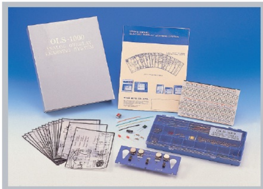
OLS-1000模拟电路透明纸学习系统