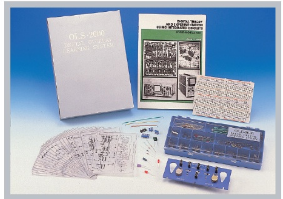
OLS-2000数字电路透明纸学习系统